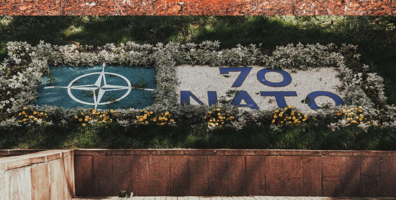
IMAGEN: MARJAN BLAN