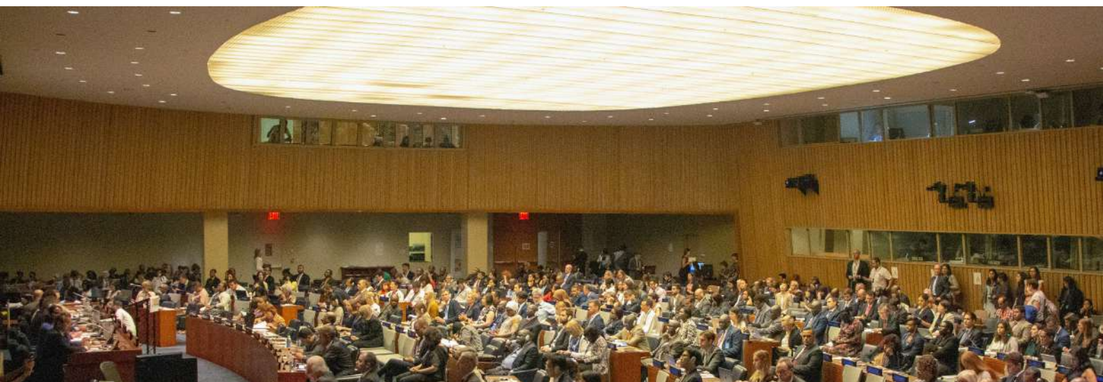
IMAGEN: MIKAEL KRISTENSON